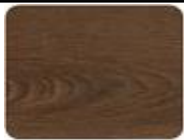
WANUT COFFE 65012