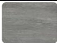
CONCRETE OAK 880274