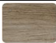
OAK LATTE 61556